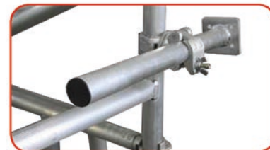
Su richiesta: ancoraggio rapido regolabile facoltativo. Se Millenium S viene ancorato le staffe stabilizzatrici non sono obbligatorie ma devono essere montate in caso di spostamento.