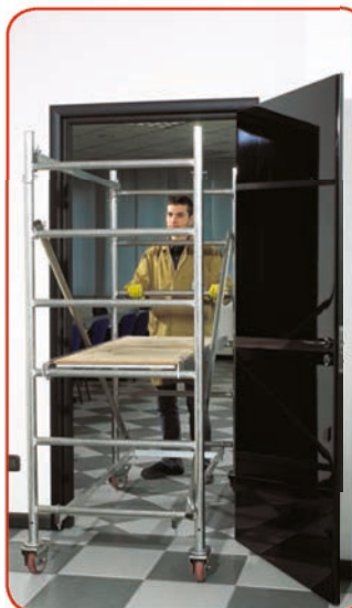
Passa attraverso porte standard