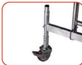
Su richiesta: Set 4 livellatori da cm 0 a cm 20 - Kg 1,6: