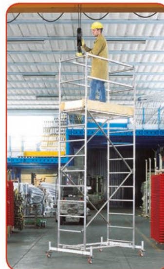
Millenium® m 3,81 (Moduli A+B)