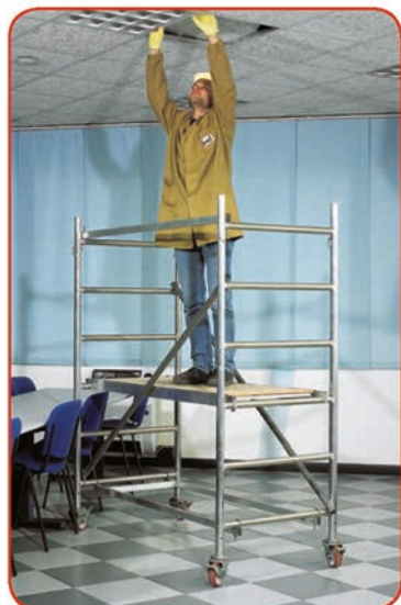
Millenium® m 1,95 (Modulo A)