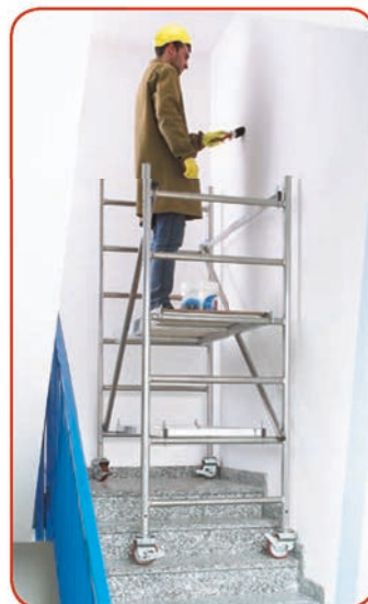
Modulo A zoppo su scale