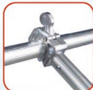
agganci rapidi Millenium S