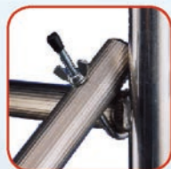
agganci a vite Millenium